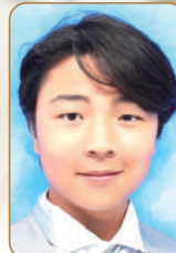
並木 嶺 連弾中級B